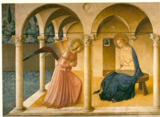
Fra Angelico: Zvestovanie