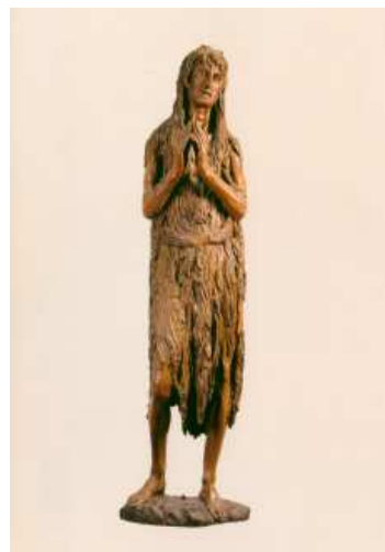
Donatello: Mária Magdaléna